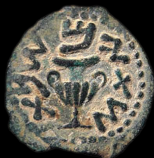
מטבע המרד הגדול